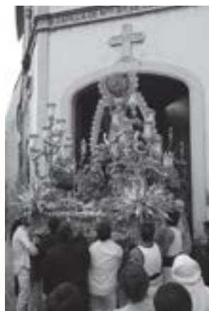
imagen de nuestra Amantísima Titular recorriendo las calles de la feligresía de San Vicente. Muchos sevillanos estuvieron junto a la Virgen de las Mercedes. La Banda de la Puebla del Río fue quien puso los sones musicales como cada año, interpretando un repertorio variado de marchas alegres, clásicas y de calidad: "Saeta Sevillana, Ntro. Padre

El sábado día 25 de septiembre, por la tarde salió procesionalmente desde su Capilla de la Puerta Real la